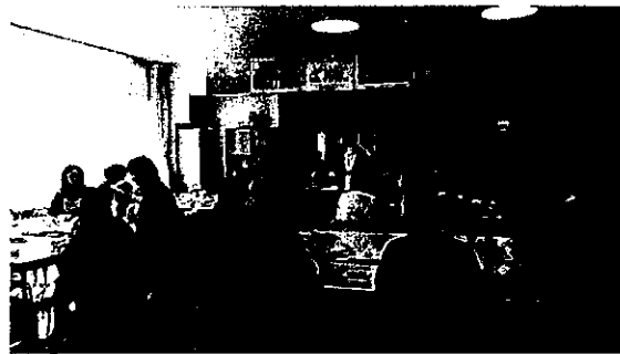
佐久歩け歩け運動昼食提供