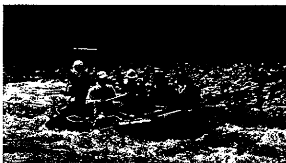
森の学校化石発見調査補助