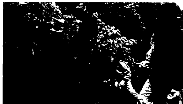
第1回地層観察教室