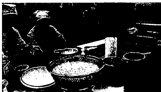
森の学校夕食準備